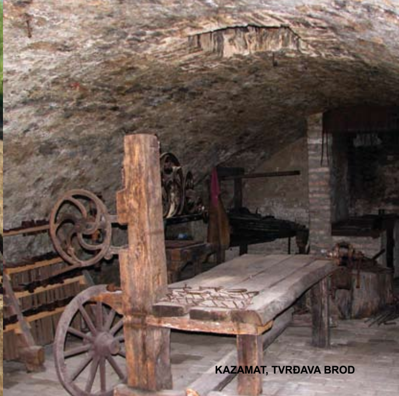
KAZAMAT, TVRĐAVA BROD