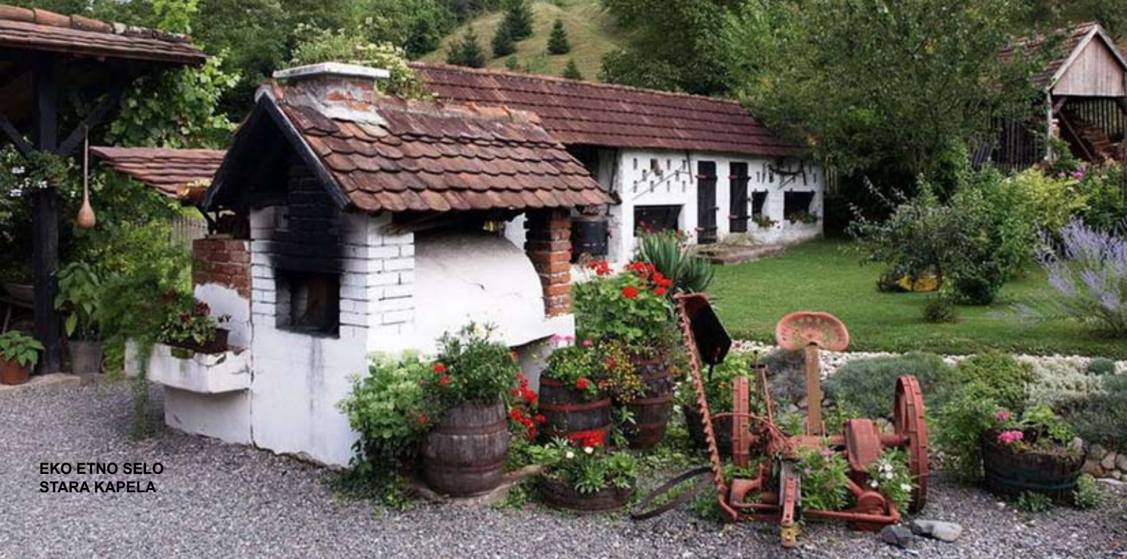
EKO ETNO SELO STARA KAPELA