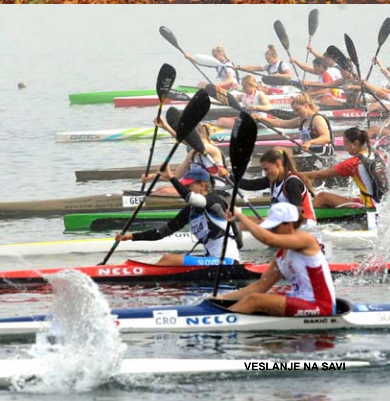
VESLANJE NA SAVI

Sportska tradicija i brojni sportski klubovi su utjecali na izgradnju sportskih dvorana i terena za sve vrste sportova. Kombinacija sportskih kapaciteta i dobrih smještajnih kapaciteta, odlične gastronomske ponude i zabavnih sadržaja čine našu županiju pogodnom za organizaciju velikog broja sportskih natjecanja.