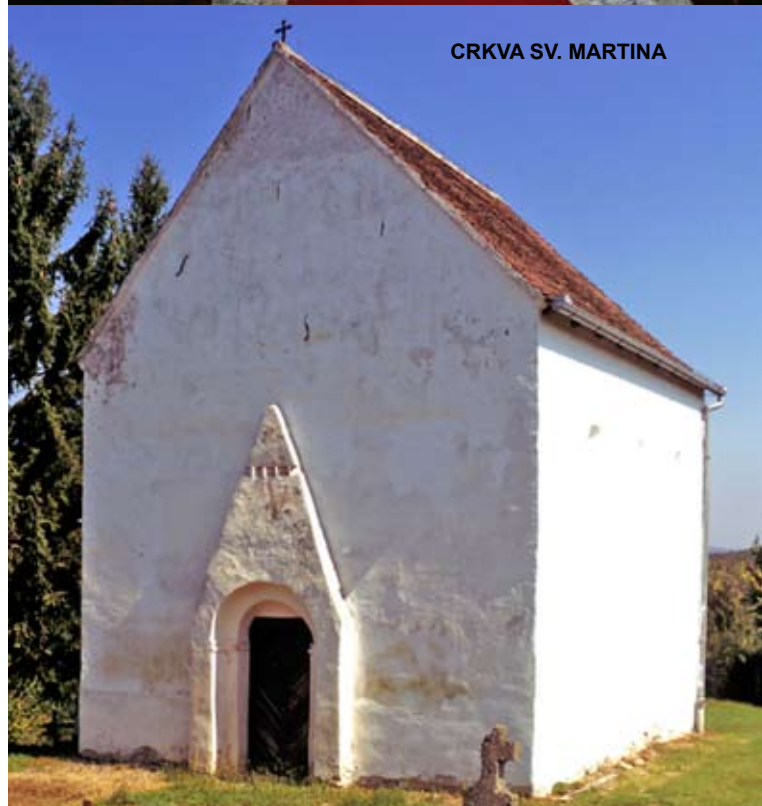
CRKVA SV. MARTINA