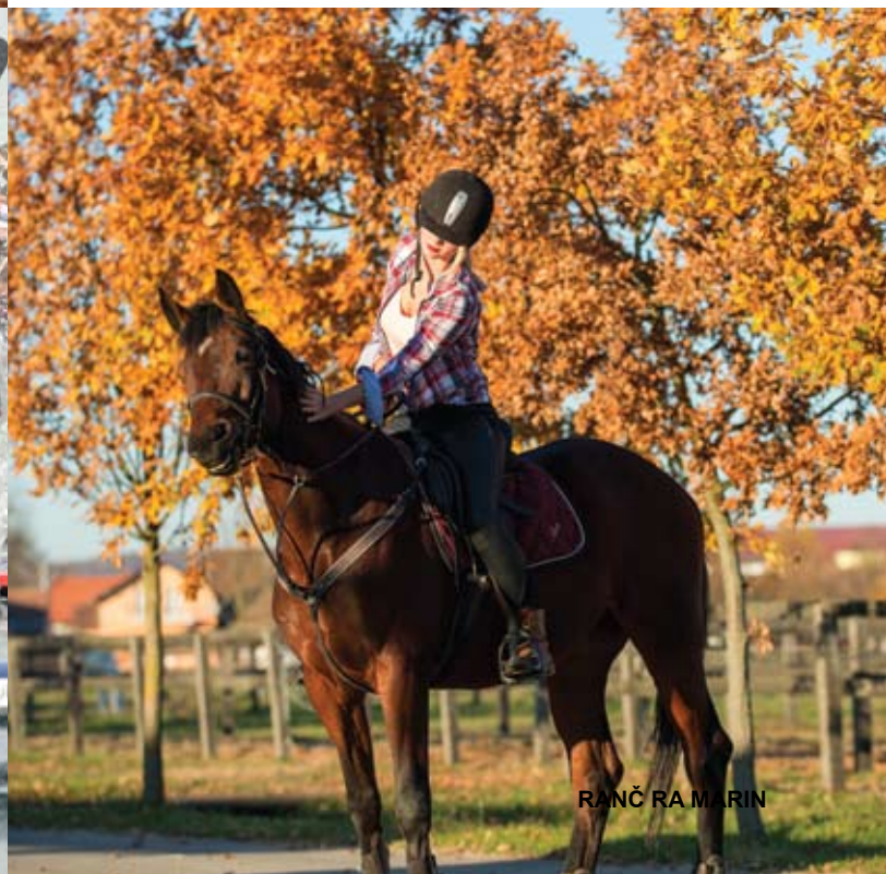
RANČ RA MARIN