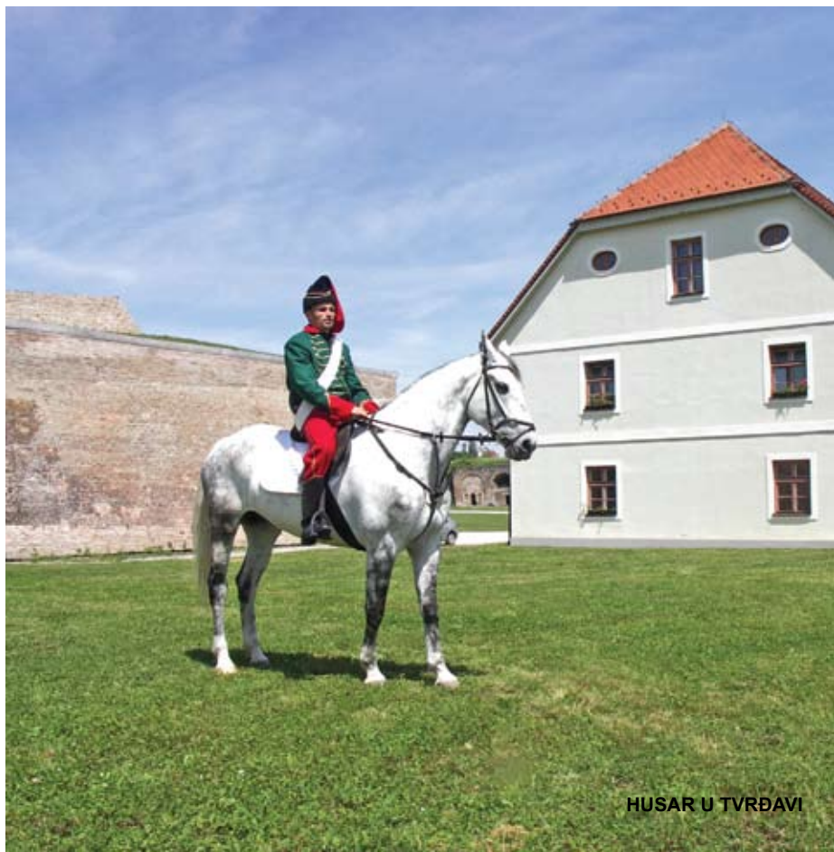
HUSAR U TVRĐAVI

S dolaskom Slavena, mijenja se etnička slika stanovništva. Tijekom srednjeg vijeka