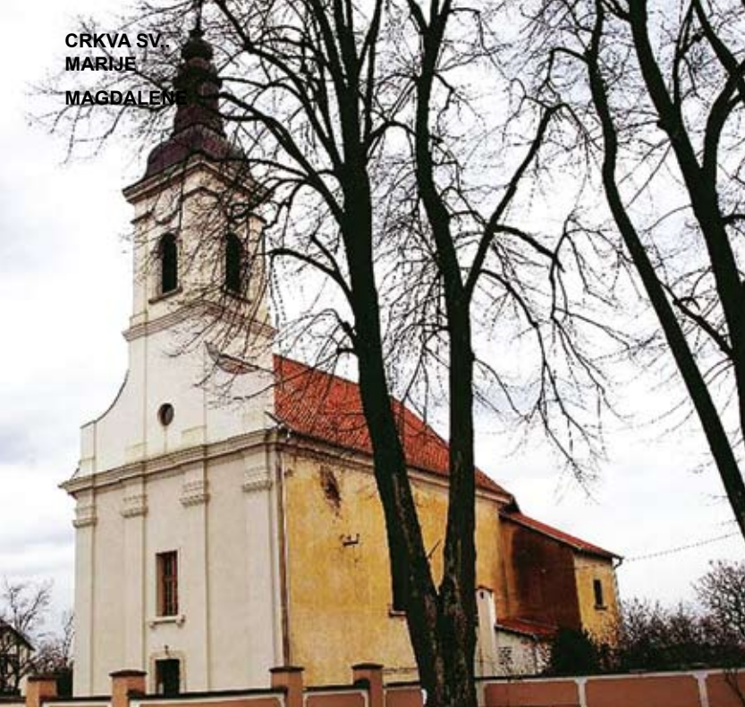
CRKVA SV. MARIJE MAGDALENE