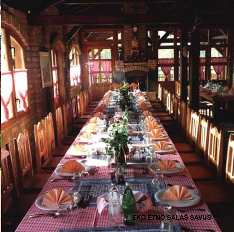
EKO ETNO SALAŠ SAVUS