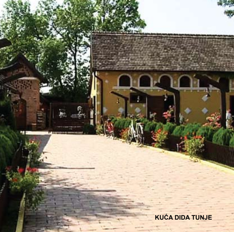
KUĆA DIDA TUNJE