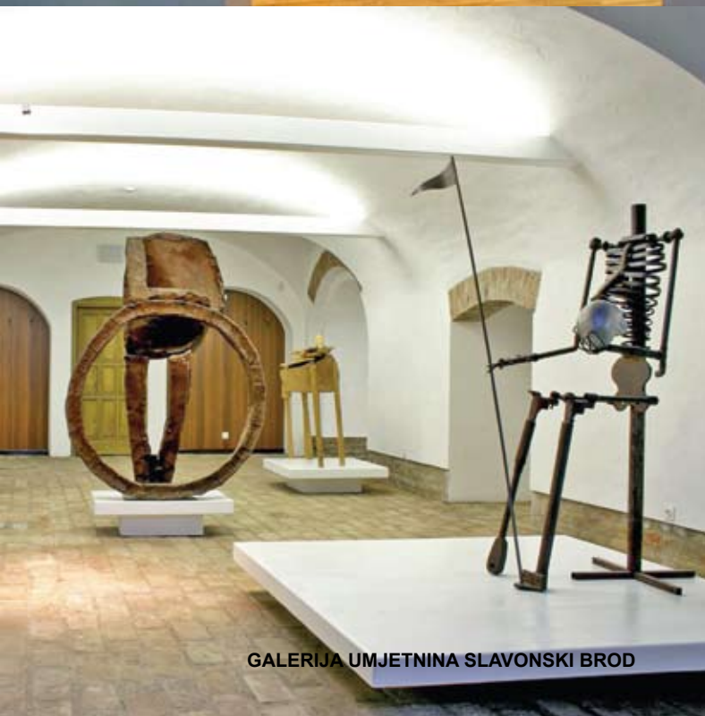
GALERIJA UMJETNINA SLAVONSKI BROD