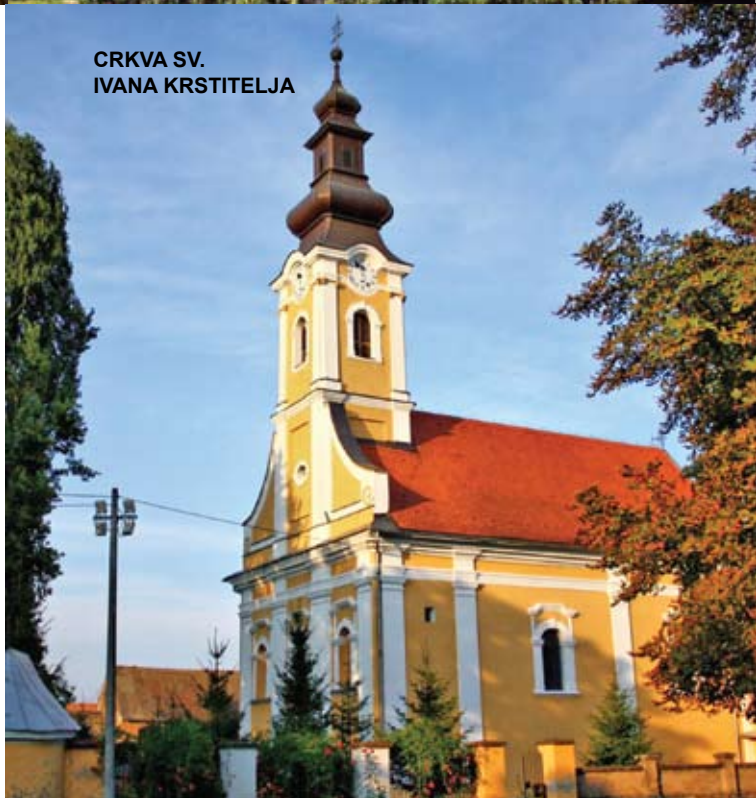
CRKVA SV. IVANA KRSTITELJA

Zbog velikih razaranja i iseljavanja tijekom ratova protiv Osmanlija Slavonija je u urbanom razvitku kasnila za ostatkom Hrvatske te obnova naseljenosti započinje tek u 18. stoljeću. Sela se grade planski po sistemu šahovskih polja a crkve uglavnom od drveta, zbog propisa vojne krajine i potreba obrane granice. Duž Save grade se nadzorne stražarske postaje – čardaci. Prva zidana barokna crkva, Sv. Ivana Krstitelja, gradi se u Slavonskom Kobašu tek 1780. U njoj je posebno interesantna zavjetna slika na kojoj se nalazi detalj iz života graničara 8. Gradiške krajiške pukovnije. Lijepi primjeri sakralnog baroka u selima brodsko-posavske županije su i crkve Sv. Marije Magdalene u Bebrini i Sv. Mihovila Arhandela u Dubočcu. To su jednobrodne građevine s jednim zvonikom na pročelju, polukružnim svetištem i sakristijom na jugu. Ornamentika je jednostavna a slike u unutrašnjosti, pod talijanskim utjecajem, uz pomoć linearne perspektive, odražavaju duh slobode. Vrijedne su i crkva Rođenja Blažene Djevice Marije u Novoj Kapeli, sagrađena u tzv. terezijanskom baroku te crkva Sv. Dimitrija u Brodskim Drenovcima.