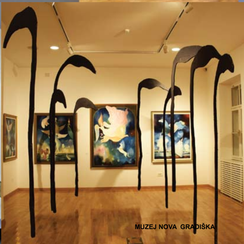
MUZEJ NOVA GRADIŠKA